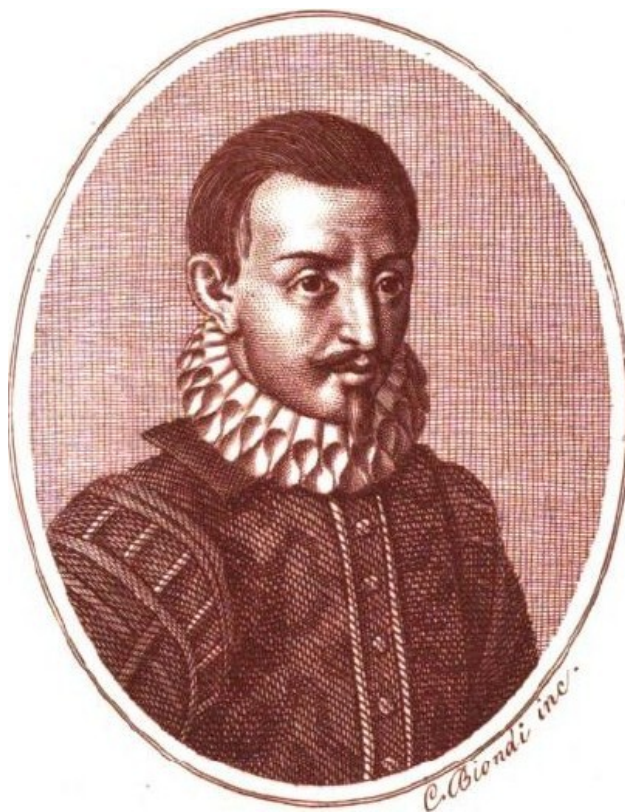
Cataldo Parisio Sículo

Foi Cataldo Sículo quem introduziu em Portugal o latim «pagão», a linguagem dos humanistas do Quattrocento e Cinquecento , substancialmente diferente do latim eclesiástico medieval. As epístolas de Cataldo ensinaram aos portugueses a eloquência à la mode , os maneirismos e as elegantes figuras retóricas deste novo latim, visando o “falar polidamente”. Cataldo introduziu, fundamentalmente, as «boas maneiras» e a retórica do Renascimento.