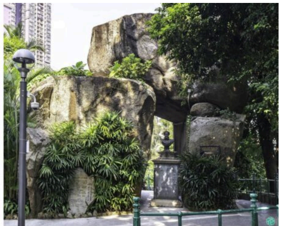
Gruta de Camões