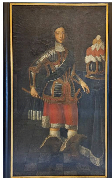
Lisboa, Arquivo Nacional da Torre do Tombo, Anónimo, Retrato do Príncipe D. Teodósio (século XVII).

educação e aspetos culturais reúnem informações relevantes, nomeadamente transcrições de excertos de obras escritas pelo príncipe, e aos quais o autor teve acesso[3].