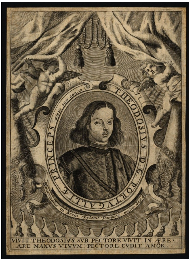
Lisboa, Biblioteca Nacional de Portugal, Thomas Dudley (atribuído), Theodosius D. G. Portugalliae Princeps aetatis suae ann. 19 (c. 1653).