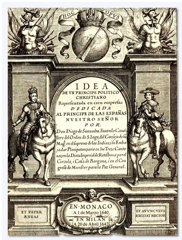
Frontispício da obra de Diego Saavedra Fajardo, intitulada Idea de un Principe Politico Christiano representada en cien empresas (1640).

de Geber[70]. Erudito muçulmano, dedicou-se aos estudos de alquimia, astronomia, arquitetura e medicina, entre outros. O intelectual radicado em Roma havia encontrado, através dos seus intermediários, uma raríssima obra do autor, que procurara ao longo de 50 anos[71].