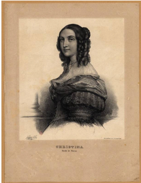
Lisboa, Biblioteca Nacional de Portugal, José Joaquim Lopes, Cristina, Rainha da Suécia (c. 1850).

Não é improvável que Cristina da Suécia tivesse recebido igualmente Commentaria Sueciae, & Gothicae Historiae , ou, quando muito, esta obra foi redigida com o propósito de regalar a soberana nórdica[95]. É possível encontrar uma cópia do referido manuscrito na Biblioteca Nacional de Portugal, presumindo-se que uma versão tenha permanecido em Lisboa[96]. O exemplar encontra-se incompleto, constando essa informação no inventário de manuscritos, publicado em 1896, por José António Moniz[97]. Algumas anotações sobre o título da obra permitem verificar que, em data próxima à da edição em questão, se estabeleceu contacto com o diretor da Biblioteca Real de Estocolmo, que permitiu esclarecer algumas dúvidas relativamente ao livro[98].