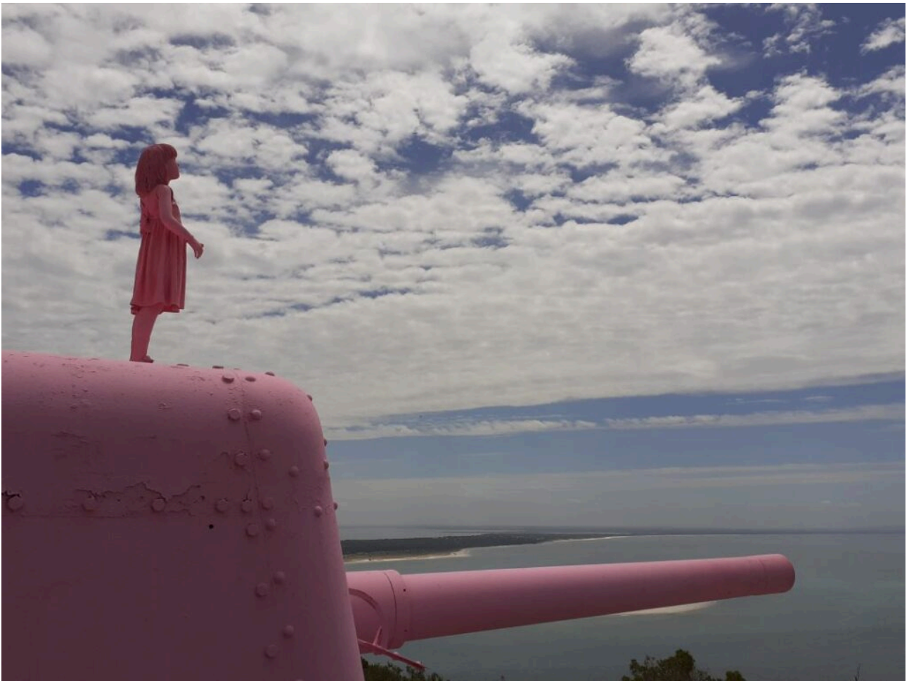
Serra de Arrábida, Setúbal (Julho 2021)