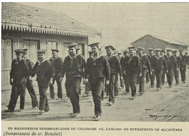
OS MARINHEIROS DESEMBARCADOS DO CRUZADOR «D. CARLOS I» NO ENTREPOSTO DE ALCÂNTARA (Instantâneos do sr. Benoliel) Joshua Benoliel, Momento da aproximação, dos marinheiros desembarcados do cruzador «D. Carlos I», ao quartel localizado em Alcântara (1906). Publicado em O ocidente: revista ilustrada de Portugal e do estrangeiro, 10 de abril de 1906.