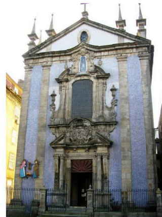
Igreja de São Nicolau, Porto.