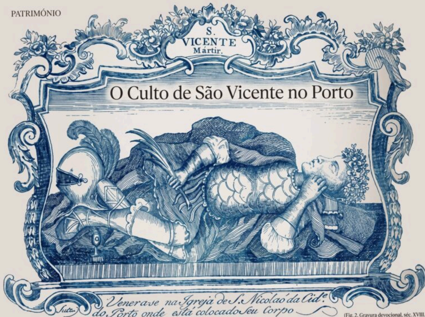
(Fig. 2. Gravura devocional, séc. XVIII. Restauro digital preservando a pátina e os detalhes da calcografia original. Coleção Particular.)