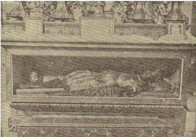
Figura do corpo jacente de São Vicente Mártir.

“Portugal Antigo e Moderno”, volume sexto, de doze, imprimidos entre os anos de 1873 a 1890, refere precisamente este caso, transcrevendo o que o erudito padre do fim do século XVIII escreveu, especificando concretamente que o “corpo de S. Vicente martyr” se encontra depositado “em um altar colateral” da dita igreja; sabe-se que ainda estava nesta disposição no início do século XX, como mostra o doutor Souza Viterbo (1845-1910) no seu artigo intitulado “Relíquias de Santos” vindo a lume na página 19 da revista “O Tripeiro”, Porto, 10 de janeiro de 1909, onde apresenta a fotografia da figura do corpo jacente de “O martyr S. Vicente que se venera na Igreja de S. Nicolau”, que temos o ensejo de a reproduzir, interrogando-se e bem o historiador se no Flos Sanctorum (4) inscreve mais de um mártir sob o nome de S. Vicente, sobretudo pelo facto de na Sé portuense se guardar “um braço de S. Vicente”, como diz e informa “João Baptista de Castro na relação das relíquias que traz no seu Mappa de Portugal”. Com efeito, tem toda a razão o arguto historiador Sousa Viterbo nascido na cidade do Porto e falecido em Lisboa, ao notar tal facto em relação à multiplicidade e existência do Santo São Vicente.