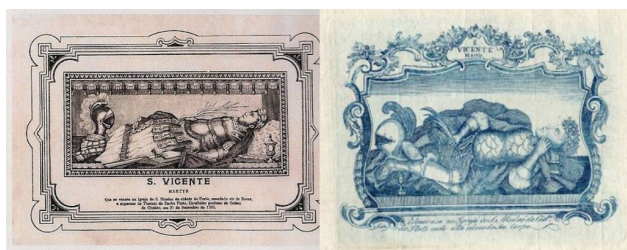
Pagela São Vicente, Mártir