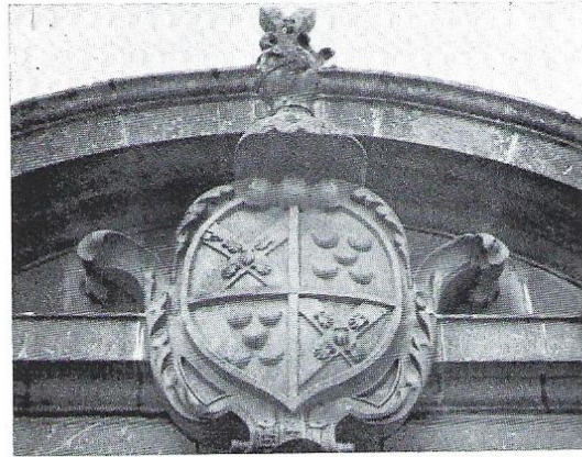
Pedra d’Armas da família Rocha Pinto, montada depois de 1815, na quinta de Santa Cristina, Santo Tirso.