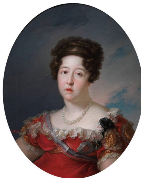
Vicente López Portaña, Retrato da rainha D. Maria Isabel de Bragança (c. 1816), Madrid, Museu do Prado, n.º inv. P000869.

Anos mais tarde, em 1816 quando D. Maria Isabel casou com o seu tio Fernando VII, aos 19 anos de idade, estava uma mulher formada, considerada pronta para integrar uma nova corte, ao lado do seu marido. Foi rainha consorte em Espanha durante apenas dois anos, dado que faleceu inesperadamente ao dar à luz a 26 de dezembro de 1818. Não obstante o curto período em que foi casada com o monarca, atendendo aos relatos existentes, terá sido uma figura admirada pelo povo espanhol, em função da sua forma de saber estar, da sua educação, e da sensibilizada pelas artes. O povo espanhol entendeu a chegada de D. Maria Isabel como um momento de esperança que viria assegurar a sucessão dinástica e dar estabilidade a Espanha, após um período conturbado de revoltas.