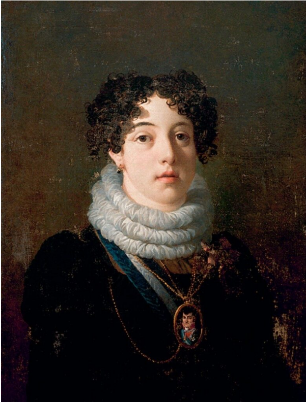
Nicolas Antoine Taunay, Retrato da infanta D. Maria Isabel de Bragança (1816). Lisboa, Palácio de Queluz, n.º de inv. PNQ 255A/4.