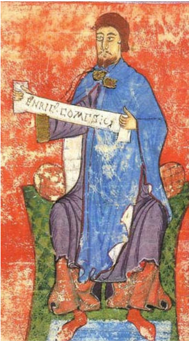
Conde D. Henrique